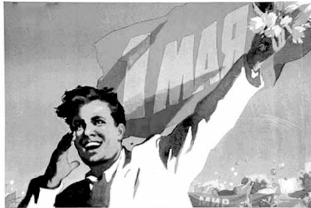
С ПРАЗДНИКОМ, ТОВАРИЩИ!

История празднования Международного дня солидарности